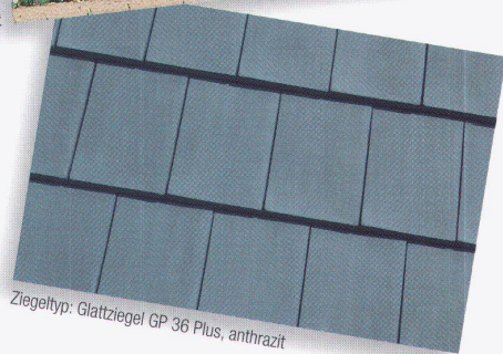
Ziegeltyp: Glattziegel GP 36 Plus, anthrazit

Das Prädikat wertvoll für Objekt und Material. Der elegante Glattziegel GP 36 Plus der Keller AG Ziegeleien für einheimische Qualität in der Architektur.