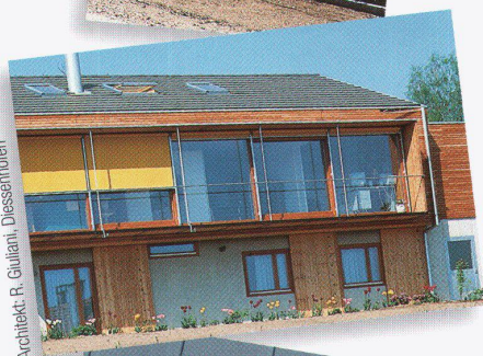
Architekt: R. Giuliani, Dlesserhofen