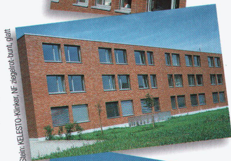
Stein: KELESTO-Klinker, NF ziegelrot-bunt, glatt