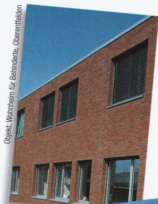
Objekt: Wohnheim für Behinderte, Oberentfelden