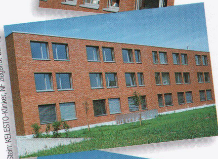
Stein: KELESTO-Klinker, NF, ziegelrot-bunt, glatt