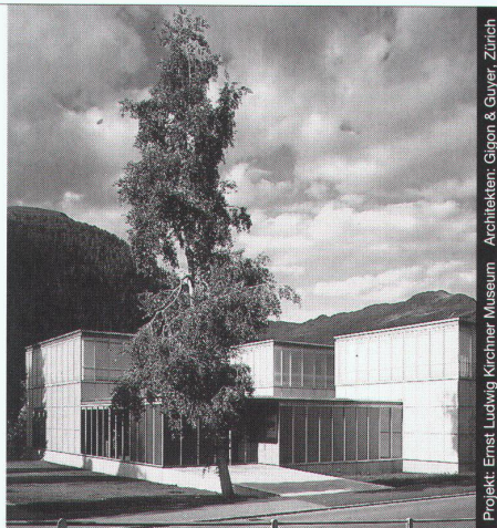
Projekt: Ernst Ludwig Kirchener Museum Architekten: Gigon & Guyer, Zürich

Ästhetik, Wirtschaftlichkeit und bauphysikalische Anforderungen in Einklang zu bringen, ist das Ergebnis ausgereifter Konstruktionen. Qualitätsbewusstsein und partnerschaftliche Zusammenarbeit sind nur einige der Voraussetzungen für ein gutes Gelingen in dieser vielfältigen Branche.