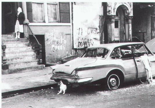
Frankfurt, Kunstverein: Helen Levitt, New York City 1974