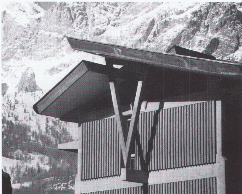
Zürich, ETH Hönggerberg: Edoardo Gellner, Gebäude für die Telve, die Post und öffentliche Ämter, Cortina d'Ampezzo 1953–1955, Ausschnitt Südostfront

Berlin, Bauhaus-Archiv. Museum für Gestaltung Andreas Feininger: Photographs 1928–1988 bis 1.6.