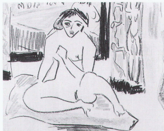
Ulm, Museum: Ernst Ludwig Kirchner, Weiblicher Akt vor dem Spiegel

München, Hypo-Kulturstiftung Picassos Sammlung anderer Künstler wie Balthus, Braque, Cézanne, Corot, Courbet, Degas, Matisse, Miró, Renoir, Rousseau und Bilder von ihm selbst 30.4.–16.8.