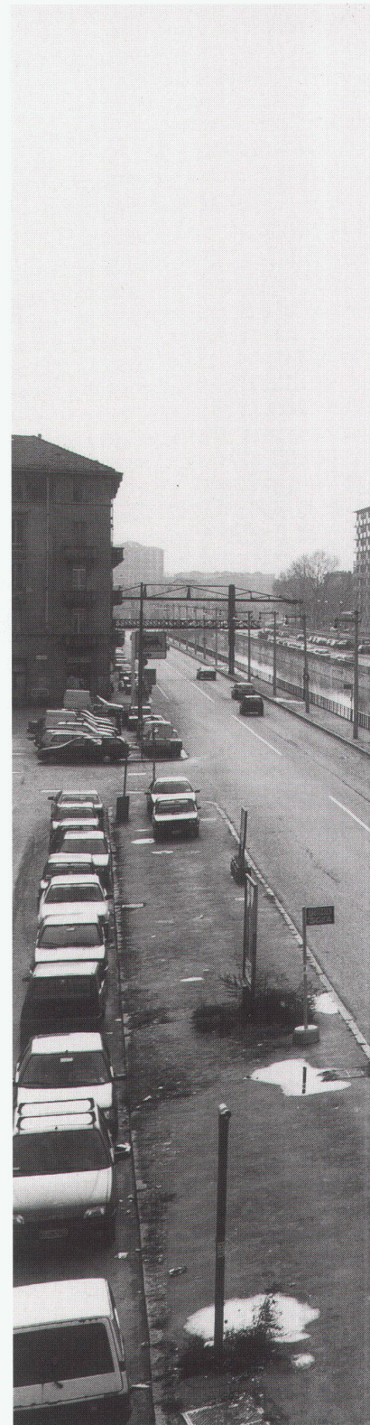
Milano, 1996 Foto: Gabriele Basilico, Mailand

Saskia Sassen unterscheidet in ihren Recherchen zu den gegenwärtigen Stadtentwicklungen vier Formen heutiger Zentralität: erstens traditionelle Ge-