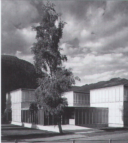
Projekt: Ernst Ludwig Kirchler Museum Architektin: Gigon & Guyer, Zürich

Ästhetik, Wirtschaftlichkeit und bauphysikalische Anforderungen in Einklang zu bringen, ist das Ergebnis ausgereifter Konstruktionen. Qualitätsbewusstsein und partnerschaftliche Zusammenarbeit sind nur einige der Voraussetzungen für ein gutes Gelingen in dieser vielfältigen Branche.