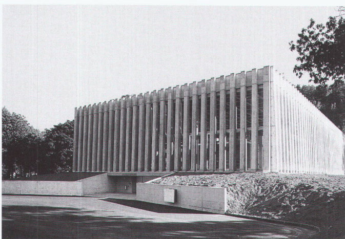
Mehrzweckhalle, Losone; Architekt: Livio Vacchini, Locarno