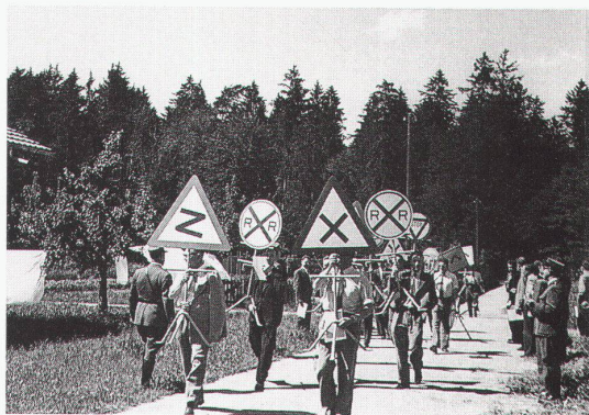
Zürich, Museum für Gestaltung: Die Strasse lebt, Fotografien 1938–1970