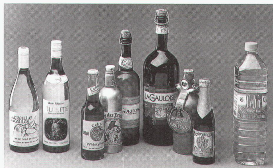
Lausanne-Vidy, Musée Romain: «Le passé recyclé»

Wien, Hermesvilla Jagdzeit: Österreichs Jagd- geschichte. Eine Pirsch bis 16.2.