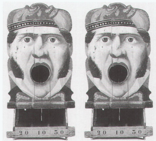
Strasbourg, Musée Alsacien: Qui perd gagne. Jeux de société

Hamm, Gustav-Lübecke-Museum Paul Klee: Reisen in den Süden 26.1.–13.4.