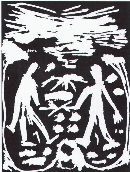
Sundern, Stadtgalerie: A.R. Penck, Das Paar, 1987, Holzschnitt

Bonn, Kunst- und Ausstellungshalle BRD Kunst aus Österreich 1896–1996 bis 10.11. Die grossen Sammlungen IV: Moderna Museet, Stockholm bis 12.1.1997