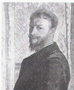
Winterthur, Kunstmuseum: Giovanni Giacometti, Selbstbildnis