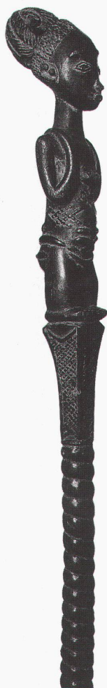
Baden-Baden, Kunsthalle: Zeremonialstab mit weiblicher Figur, Luba, Zaire

Aarau, Kunsthaus Robert Müller: Skulpturen, Zeichnungen, Druckgraphik bis 8.9.