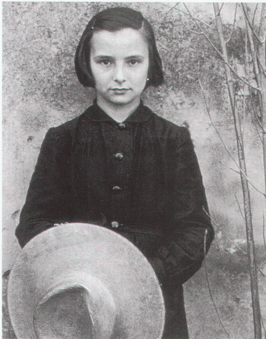
Zürich, Kunsthaut: Paul Strand, Schneiderinnen-Lehrtochter, Luzzara, Italien 1953

Dessau, Bauhaus Naturverbundenheit und industrielle Zerstörung während der nationalsozia- listischen Herrschaft bis 22.3.