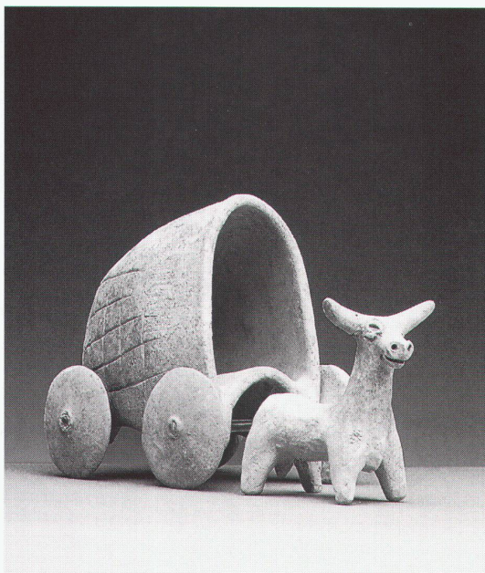
Chur, Rätisches Museum: Syrischer Planwagen, ca. 1500 v.Chr.

Braunschweig, Städtisches Museum Kunstschätze der Messe- stadt. Zur Ausstellung erscheint ein Journal, in dem die Fotos die Inszenie- rungen der Ausstellung festhalten (DM 5,-) bis 14.1.1996 Waldglas und Venezianer- glas vom 15. bis 19. Jahr- hundert bis 31.12.