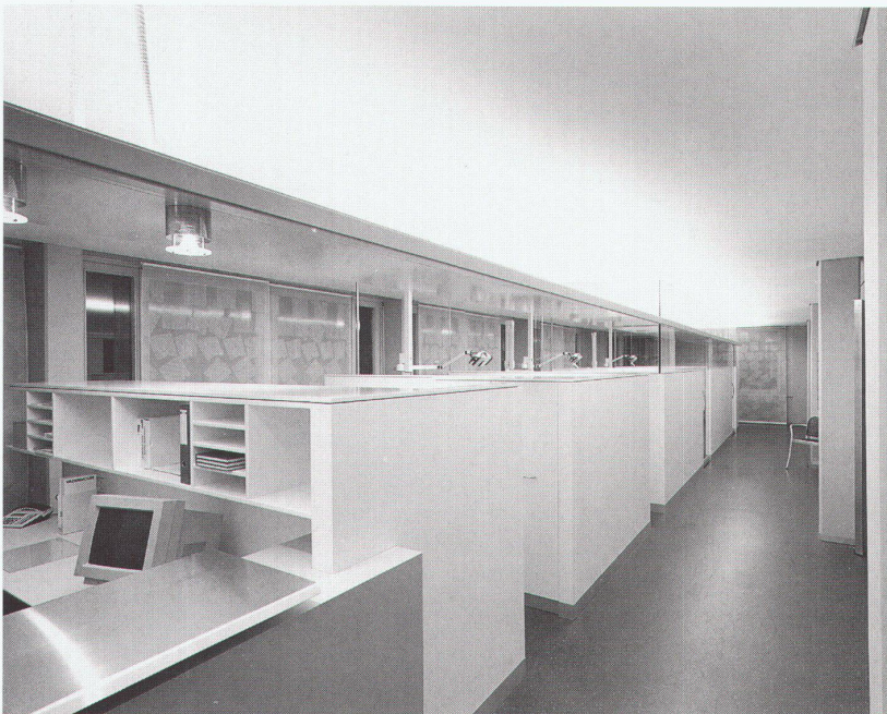
Eingang, Empfang Entrée, réception

Die Wartezone ist als konkaver, leichter Schild aus Aluminium und Sperrholz ausgeführt. Die Form, die der Funktion des Wartens entspricht, ist sehr geschickt an die Verkehrszone angebunden und hebt sich auch von der Materialisierung der sonst weissen Umgebung ab. Stefan Zwicky