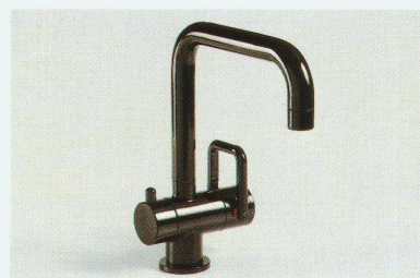
Waschtischmischer arwa-twin «1Point» (mit Eckadapter zum Rohbauset)