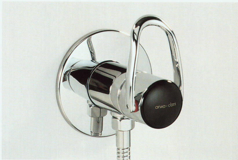
Duschenmischer arwa-class «1Point»