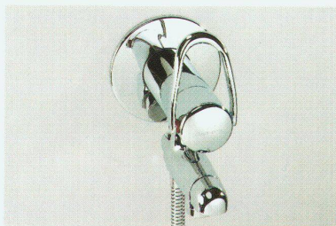
Bademischer arwa-class «1Point»