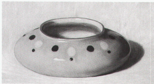
Luzern, Kunstmuseum: Hans Emmenegger, Blumenschale 1924

Freiburg, Museum für Neue Kunst Otto Dix – Die frühen Jahre bis 11.6.