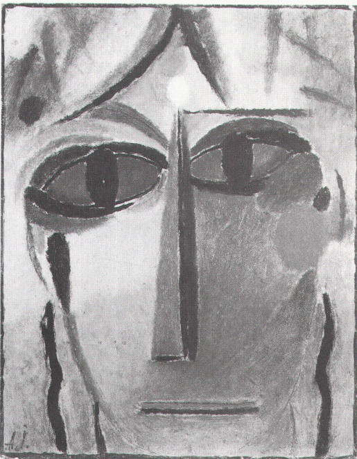
Genève, Musée Rath: Alexej Jawlensky, Heilands Gesicht, dunkle Augen, 1917 N. 21, Weisheitszeichen

Dortmund, Museum für Kunst und Kulturgeschichte Spitze: Ein altes Luxusgut zwischen Markt und Mode, Tradition und Avantgarde 1890–1914 bis 23.7. Frauen in der Arbeitswelt. Fotografien von Sybille Bergemann bis 16.7.