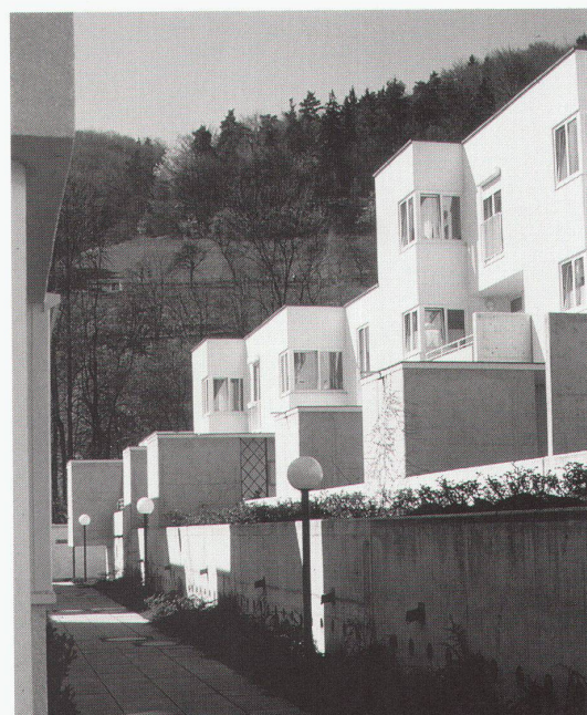
Wien, MAK – Museum für angewandte Kunst: Roland Rainer, Siedlung Leonfeldnerstrasse, Linz, Neue Heimat, 1986

Helsinki, Museum of Finnish Architecture Public Milieu. Survey of the building production of the National Board of Building bis 23.4.