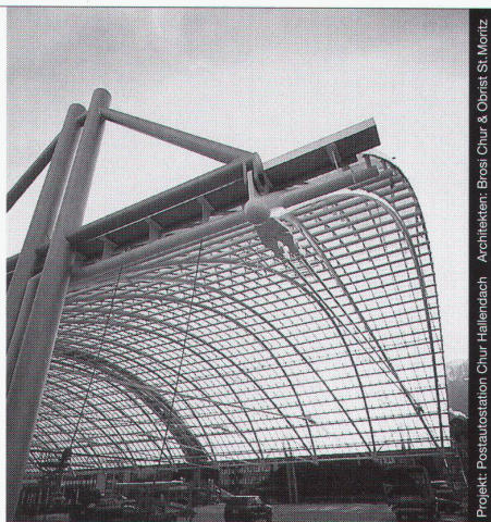
Projekt: Postautostation Chur Hallendach Architekten: Brosi Chur & Obrist St. Moritz

Stahl-Glas-Konstruktionen in architektonisch perfekter Vollendung verwirklichen wir mit innovativen Ideen und höchsten Anforderungen an Materialien und Ausführung.