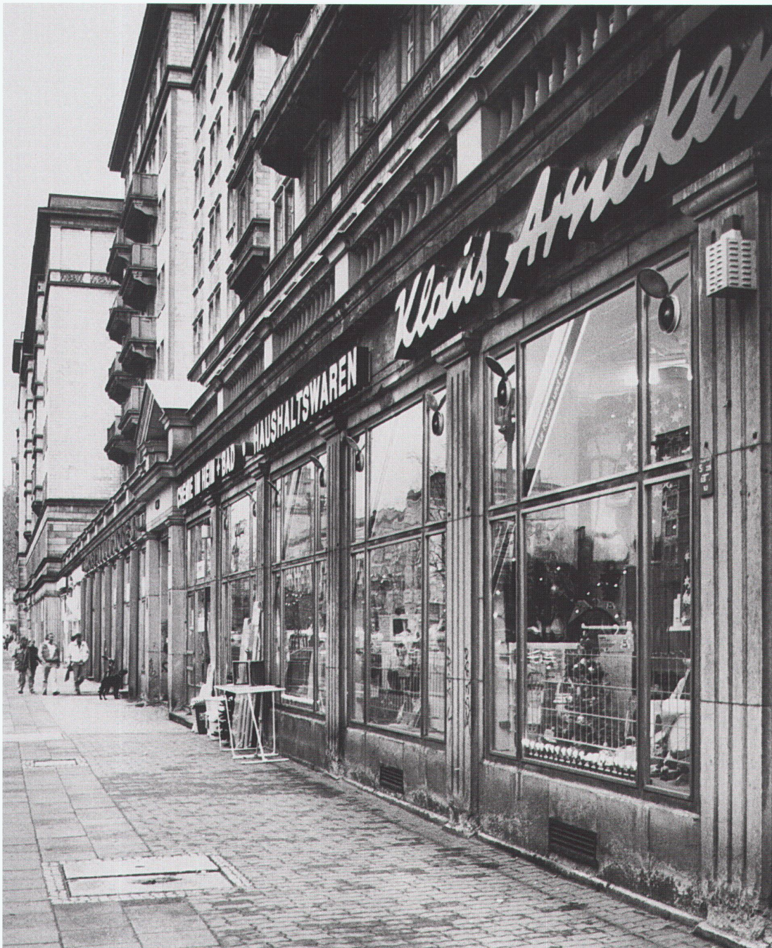
Neubau Galerie Lafayette, Friedrichstrasse Architekt: Jean Nouvel, Paris ■ Nouveau bâtiment des Galeries Lafayette, Friedrichstrasse ■ The new Galerie Lafayette building at Friedrichstrasse