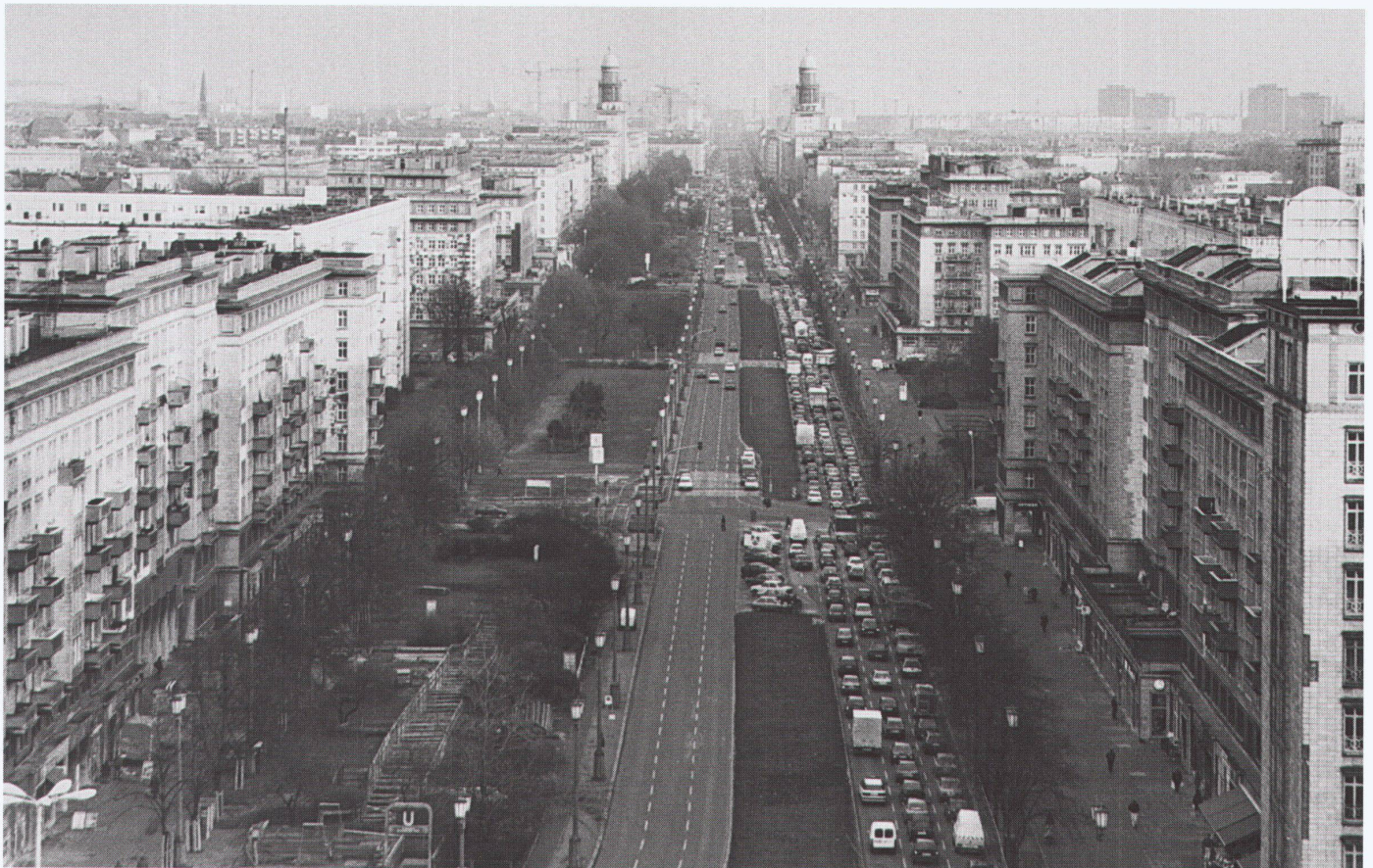
Stalinallee, Blick nach Osten Vue vers l'est View towards the east

■ Au-delà de toutes les différences dans leur mise en forme architecturale, les projets de prestige de la jeune RDA de jadis – Frankfurter Allee (d'abord Stalinallee puis Karl-Marx-Allee) et ceux venus après la réunification de la république – Friedrichstrasse – reposent sur des principes similaires: l'ancienne ville avec ses rues, ses places et ses alignements doit renaître, l'espace urbain doit être clairement défini. En regard de la pseudofidélité du respect des parcelles et le maintien subversif des hauteurs