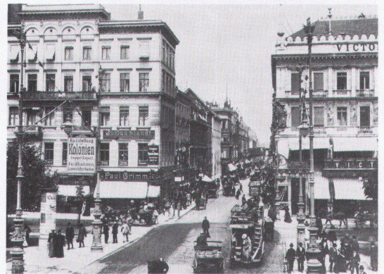
Friedrichstrasse um 1900, Blick von Norden

■ Berlin has grown out of an agglomeration of many villages and thus lacks a true centre, its virtual centre being Berlin-Mitte. This area around Friedrichstrasse is currently being rebuilt. Investors are reconstructing a part of town situated within the confines of eighteen- and nineteen-century building lines, filling it with modern uses: 20% commercial, 60% office, and 20% residential premises said to represent a typically dense urban blend of uses. However, no urban life can conceivably pulsate here. Throughout the day, this so-called centre of Berlin will teem with boring businessmen, turning desolate at night – a mere torso or virtual centre only.