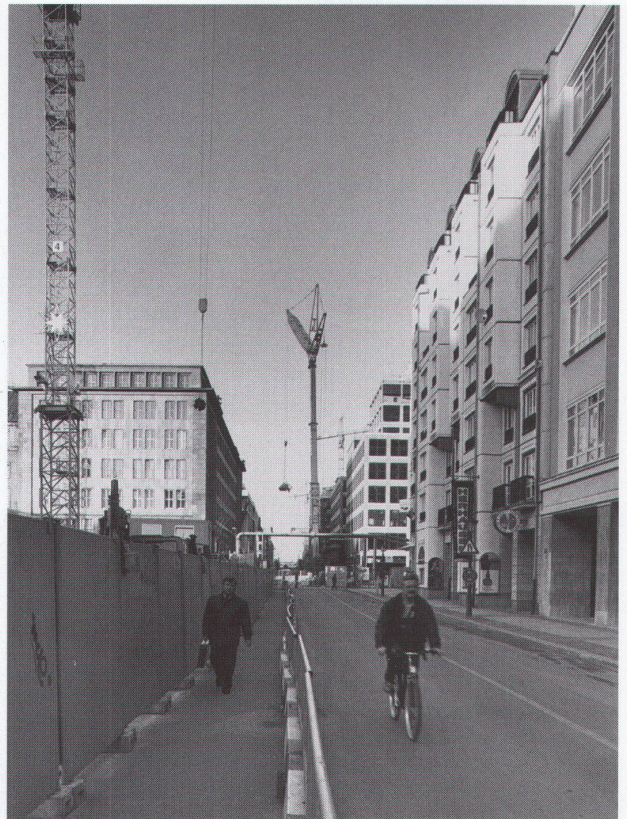
Friedrichstrasse, Ecke Kronenstrasse, Blick nach Norden ■ Friedrichstrasse, angle Kronenstrasse, vue vers le nord ■ Friedrichstrasse, on the corner of Kronenstrasse, view towards the north