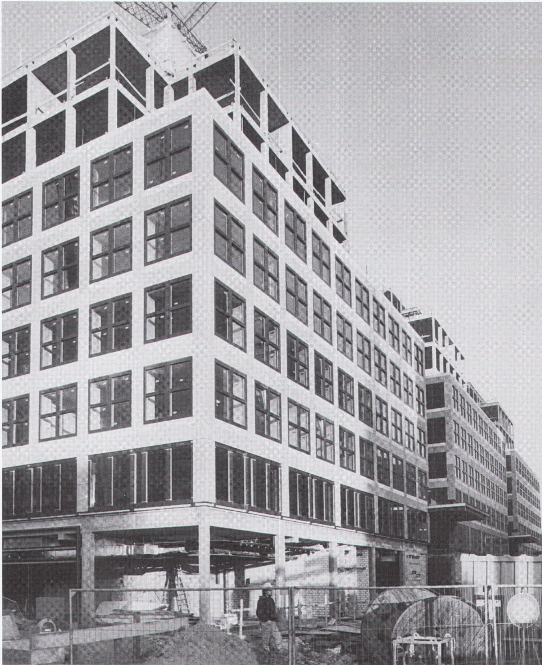
Friedrichstrasse, Ecke Mohrenstrasse, Block 205 Architekt: Oswald Matthias Ungers ■ Friedrichstrasse, angle Mohrenstrasse, bloc 205 ■ Friedrichstrasse, on the corner of Mohrenstrasse, block 205