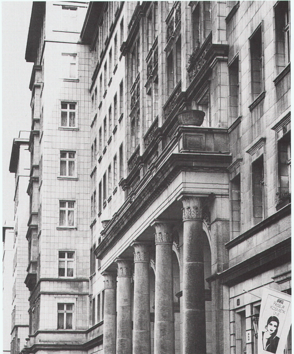
Stalinallee, Fassadendetail Détail de façade Detail of the façade

Fassaden vermitteln zwischen Innen und Aussen, setzen Privat und Öffentlich zueinander in Relation. Die palastähnliche Architektur der Stalinallee zieht sich als einheitliche Komposition um die gesamte, von den gewaltigen Baukörpern definierte Platzfolge herum und betont damit das Primat des Stadtraums. Weniger entscheidend – weil als Zeichen historisch gebrochen – erscheint die Symbolik der Fassadenarchitektur an der Stalinallee. An der Friedrichstrasse indes dominieren einzelne Architekturen privater Bauherren, jede für sich, Block für Block. Ist es demzufolge lautere Absicht der Berliner «Traditionallisten», mittels einförmiger Steinfassadenhüte die Friedrichstrasse wenigstens optisch noch erträglich zu machen? Ganz abgesehen davon, dass sie damit auf verlorenem Posten stehen, darf man füglich