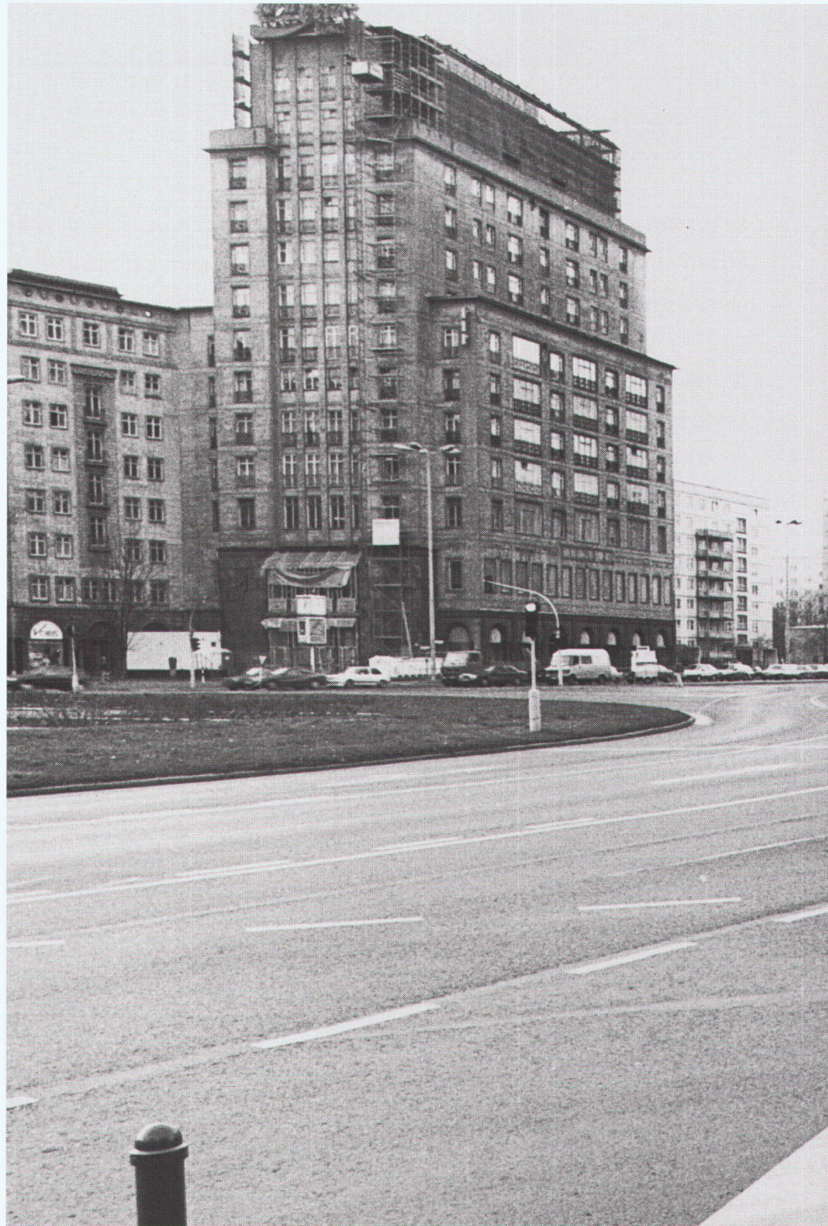
Stalinallee, Frankfurter Tor, Blick nach Osten Vue vers l'est View towards the east