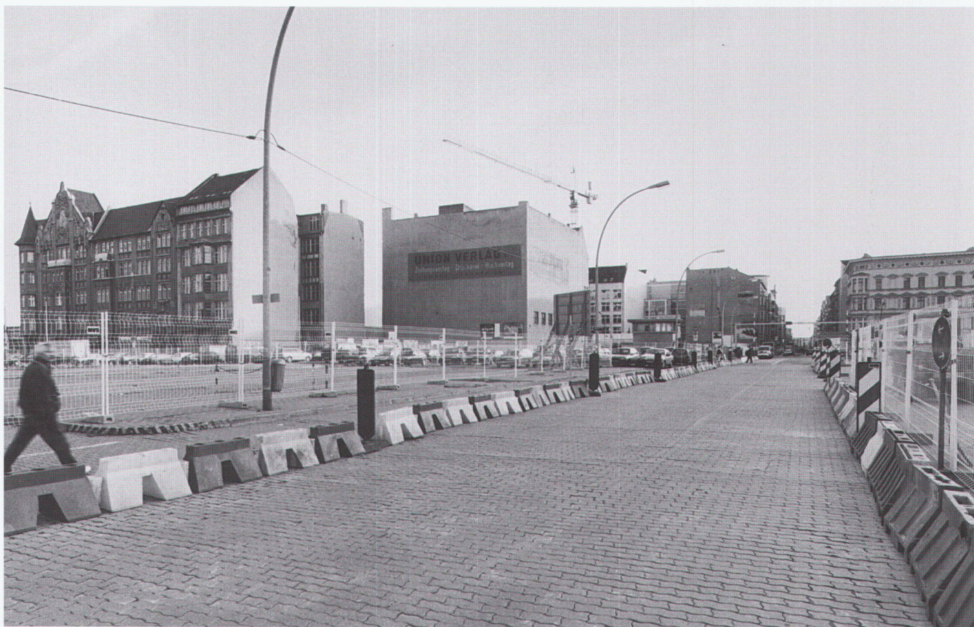
Friedrichstrasse, Ecke Leipzigerstrasse, Blick nach Norden ■ Friedrichstrasse, angle Leipzigerstrasse, vue vers le nord ■ Friedrichstrasse, on the corner of Leipzigerstrasse, view towards the north