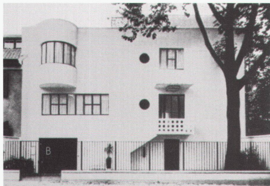
Haus Bomsel, 1925–1926, Architekt: André Lurçat

sondern konsequent ihm zu folgen suchten und entsprechend ihre Entwürfe formulierten und realisierten.