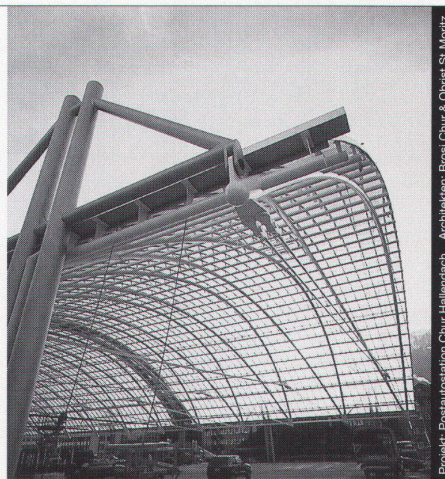
Projekt: Postautostation Chur Hallendach Architekten: Brosi Chur & Obrist St. Moritz

Stahl-Glas-Konstruktionen in architektonisch perfekter Vollendung verwirklichen wir mit innovativen Ideen und höchsten Anforderungen an Materialien und Ausführung.