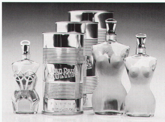
Ätherische Duftstoffe in körperhafter Hülle: als Frauentorso

Der Hamburger Architektursommer 1994 hat den runden 125. Geburtstag zum Anlass genommen, das grosse, ja geradezu gewaltige Schaffen des Architekten, Stadtplaners, Designers, Hochschullehrers, städtischen Baubeamten und