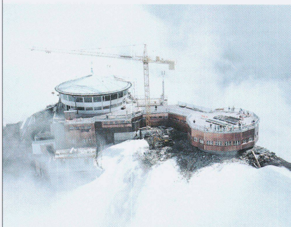
Schilthorn Gipfelstation, Architekt A.F. Feuz

R. Schmidli · Postfach 4 · 5617 Tennwil Tel. 057/273727 · Fax 057/273717 R. Diem · CP 93 · 1000 Lausanne 4 Tél. 021/3127869 · Fax 021/3129763