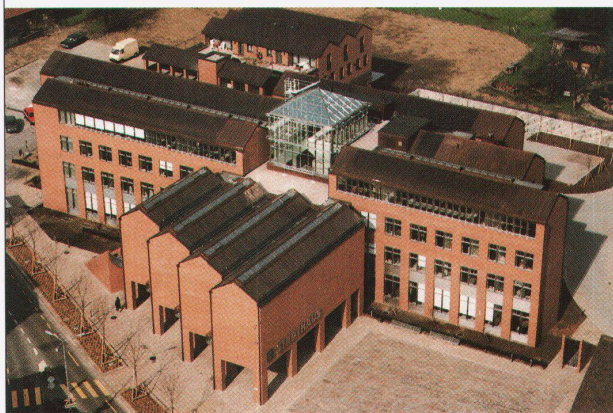
Stadthaus Dietikon, Architekten Guyer & Guyer

Ausstellungshallen Allmend Öffnungszeiten 9-18 Uhr