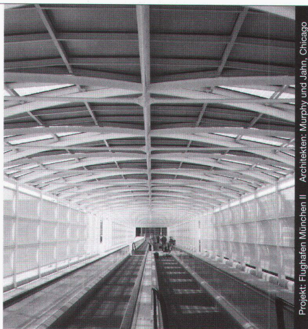
Projekt: Flughafen München II – Architekten: Murphy und Jahn, Chicago

Stahl-Glas-Konstruktionen in architektonisch perfekter Vollendung verwirklichen wir mit innovativen Ideen und höchsten Anforderungen an Materialien und Ausführung.