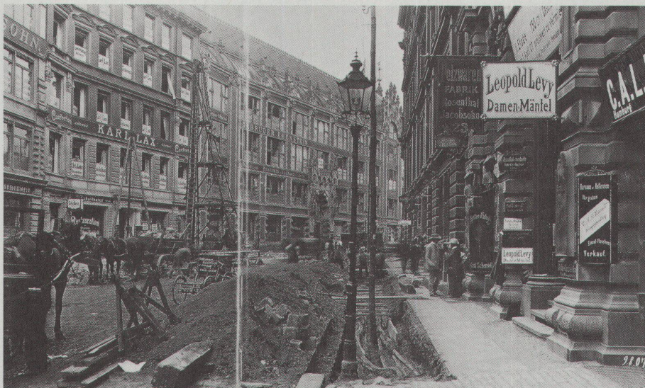
Taubenstrasse, Berlin, 1907

in der Fähigkeit, der Banalität dieser Ereignisse eine Form zu geben, die über sie hinausweist.