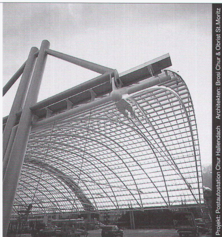
Projekt: Postautostation Chur Hallendach Architekten: Brossi Chur & Obriet St. Moritz

Stahl-Glas-Konstruktionen in architektonisch perfekter Vollendung verwirklichen wir mit innovativen Ideen und höchsten Anforderungen an Materialien und Ausführung.