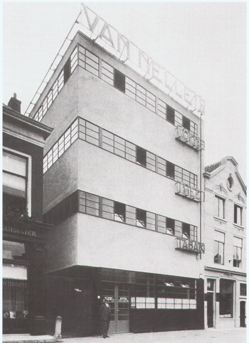
Filiale van Nelle in Leiden, 1926