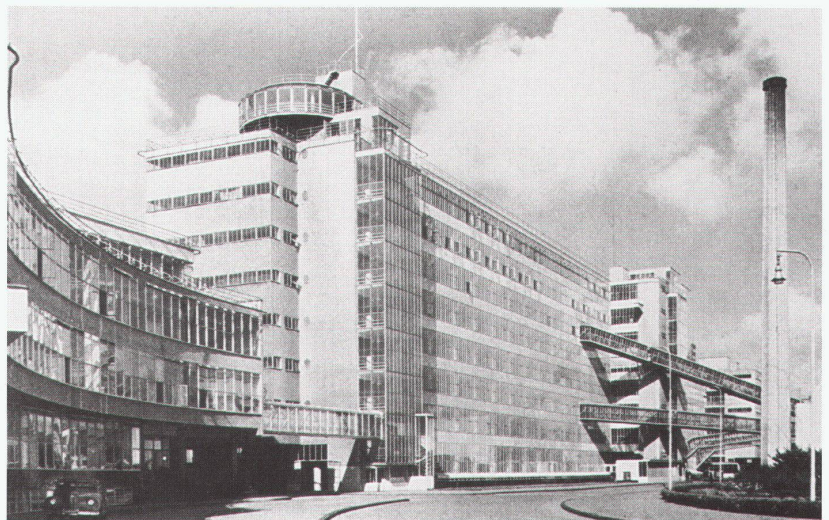
Büro- und Fabrikgebäude van Nelle in Rotterdam, 1925–1930