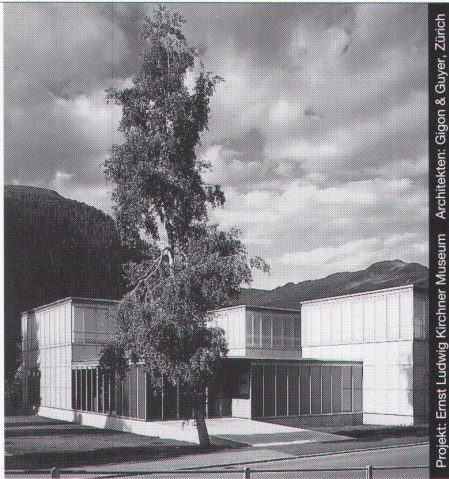
Projekt: Ernst Ludwig Kirchner Museum Architekten: Gligon & Guyer, Zürich

Ästhetik, Wirtschaftlichkeit und bauphysikalische Anforderungen in Einklang zu bringen, ist das Ergebnis ausgereifter Konstruktionen. Qualitätsbewusstsein und partnerschaftliche Zusammenarbeit sind nur einige der Voraussetzungen für ein gutes Gelingen in dieser vielfältigen Branche.