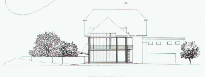
Erweiterung Unterstufenzentrum der Gemeinde Bremgarten b. Bern, 1990 (Wettbewerb)

■ ■ ■ Kann vom Betroffenen selbst nicht beantwortet werden.