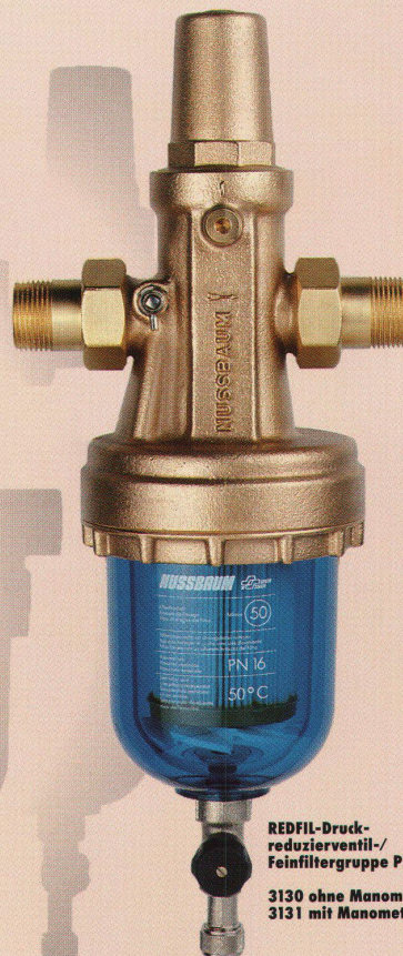
REDFIL-Druck- reduzierventil-/ Feinfiltergruppe PN 16 3130 ohne Manometer 3131 mit Manometer

Dank dem REDFIL ist der Einbau eines Feinfilters keine Platzfrage ... auch nicht bei nachträglichem Einbau in bestehende Anlagen.