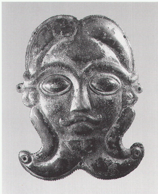
Chur, Rätisches Museum: Bronze- maske, Zierbeschlag einer Holz- kanne aus einem keltischen Krie- gergrab, 5. Jh. v. Chr.

Genova, Palazzo Ducale Sardegna: Civiltà di un'isola mediterranea bis 15.2.