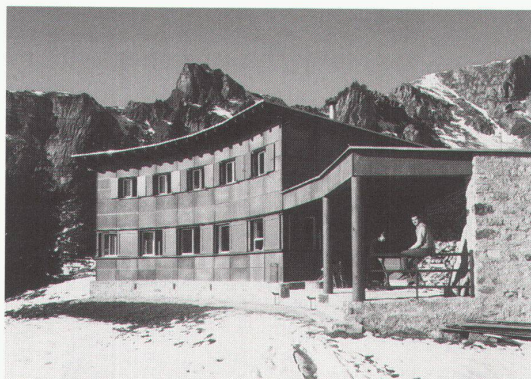
Sporthaus Ortstock, Braunwald-Alp, 1931; Architekt: Hans Leuzinger