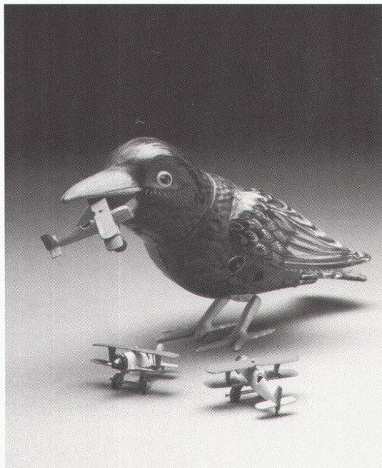
Ancienne Boucherie, Strasbourg: Donation Ungerer

Firenze, Istituto degli innocenti Salvador Dalí bis 30.9.