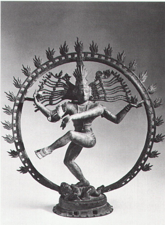
Zürich, Museum Rietberg: Tanzender Shiva (Nataraja), Bronze, Südindien, 11. Jh.

Genève, Musée d'art et d'histoire Bleus d'Egypte: De la peinture à la céramique au temps des pharaons bis 19.9.