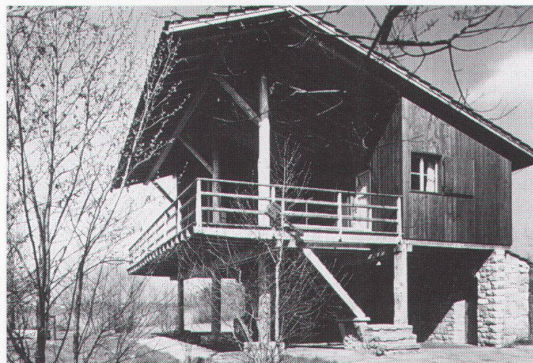
Ferienhaus Müller, Schenkön; Architekt G. Panozzo