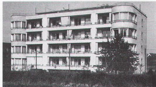
Holeestrasse 131-135, Basel; Architekt G. Panozzo

Bei diesem Beitrag wurden leider falsche Abbildungen publiziert. Wir zeigen nachstehend die genannten Bauten von Giovanni Panozzo.