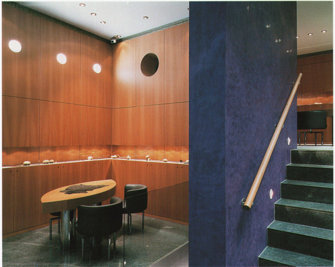
Beratungstisch Eingangsebene, Aufgang Zwischengeschoss Table de conseiller au niveau d'accès, montée vers l'étage intermédiaire

Die Liegenschaft Vadianstrasse 15 in St. Gallen, ein älteres Gebäude aus dem Jahre 1902, wurde renoviert und innen umstrukturiert. Im Erdgeschoss wurde die ehemalige Erschliessung von aussen aufgehoben und zwei spiegelbildlich gleiche Verkaufsräume geschaffen. In der linken Hälfte hat sich der Goldschmied Richard Lux vom Architektenpaar Trix und Robert Haussmann ein Goldschmiedegeschäft einrichten lassen. Auf engstem Raum, ca. 100 m 2 Nutzfläche, befinden sich auf vier Ebenen optimal verteilt Verkaufsräume, ein Büro, Werkstätten und Nebenräume.