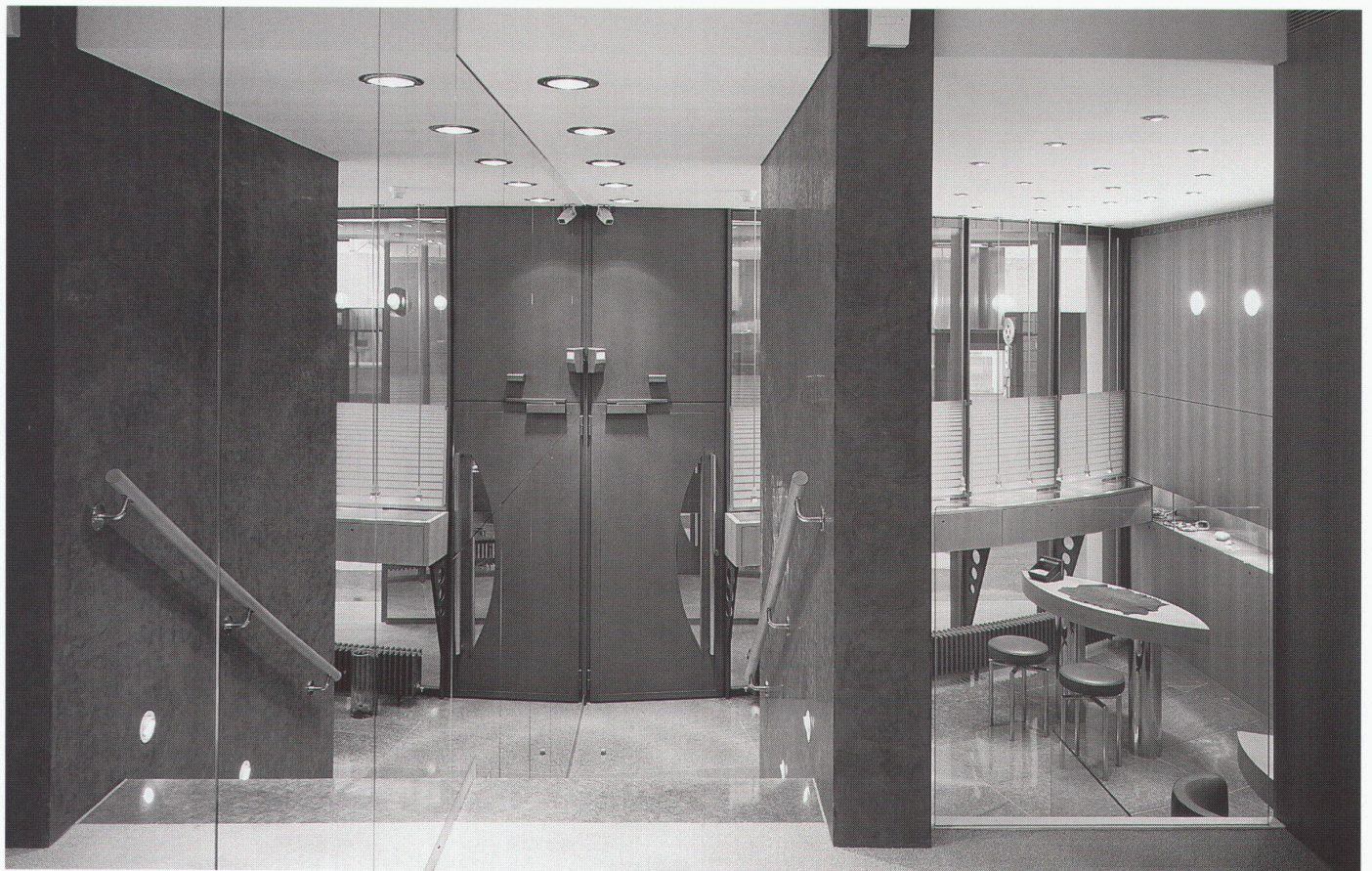
Blick vom Zwischengeschoss an die Innenfassade Vue depuis l'étage intermédiaire vers la façade intérieure