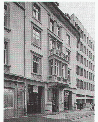
Fassade Vadianstrasse 15 Façade côté Vadianstrasse 15