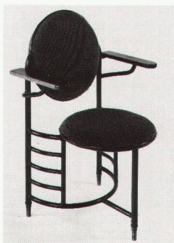
Ein von Wright in den Jahren 1937 bis 1939 entworfener Schreibtischstuhl für das Johnson-Wax-Gebäude in Wisconsin.

Wie die meisten amerikanischen Architekten war Wright nach dem Börsenkrach im Jahre 1929 lange ohne Arbeit. Zwar verdiente er sich Geld mit Vorlesungen und Veröffentlichungen, doch erst der Auftrag