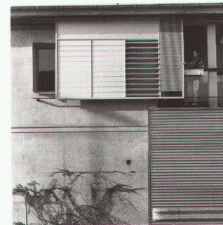
Immeuble de logements sociaux, Lausanne Architectes: Atelier Cube, Guy et Marc Collomb, Patrick Vogel