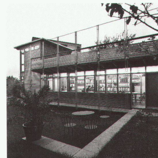
Maison familiale, Lausanne Architectes: Ueli Brauen, Doris Wälchli