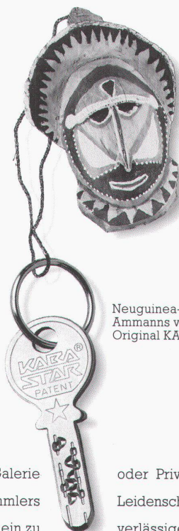
Neuguinea-Kenner Ammanns verlässlicher Original KABA® STAR.

Ob Museum, Galerie Damit des Sammlers den schafft, ist ein zu Leidenschaft keine Lei- verlässiges Schliess- system unumgänglich und auch Voraussetzung für den Versicherungsschutz. KABA® STAR bietet dank hoch- wertiger Materialwahl, computergesteuerter Präzisions- Stufenfräsung und einer astronomischen Zahl von Schliessvarianten grösstmögliche Sicherheit. Überdies sind KABA® STAR-Türzylinder auch mit einer wirkungs- vollen Panzerung erhältlich. Gönn- nen Sie sich einen ruhigen Schlaf: Schützen Sie Unikate mit KABA®, dem Original.