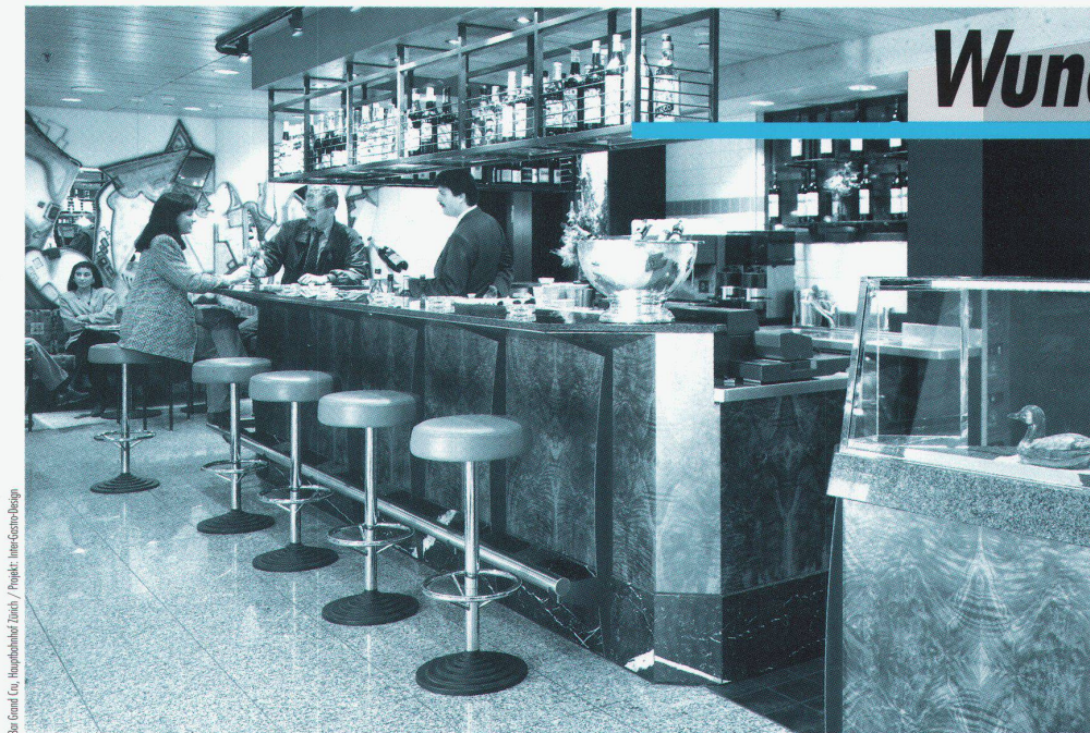
Bar Grand Cru, Hauptbahnhof Zürich / Projekt: Inter-Gastro-Design