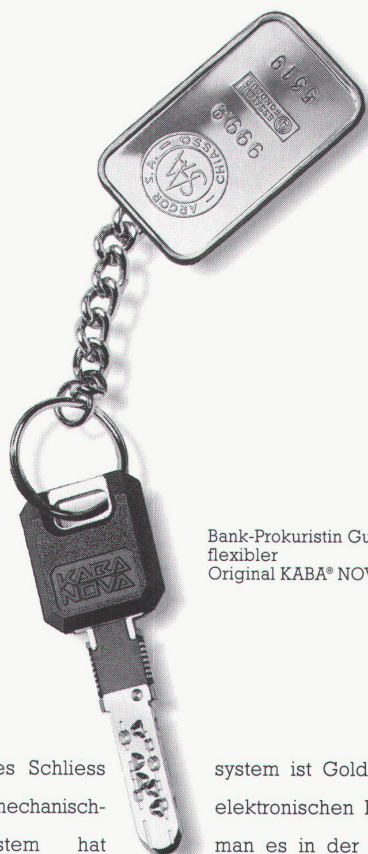
Bank-Prokuristin Gublers flexibler Original KABA® NOVA.

Ein kluges Schliesssystem ist Gold wert. Mit dem mechanisch-elektronischen KABA® NOVA-System hat man es in der Hand, wechselnde örtliche und zeitliche Zutrittsberechtigungen beliebig oft und auf einfache Weise umzuprogrammieren. Das schafft organisatorische Flexibilität und spart Verwaltungsaufwand. Und geht einmal ein Schlüssel verloren, ersetzt und blockiert ein Ersatzschlüssel den verlorenen Schlüssel. Kein Wunder, dass KABA® NOVA-Schliesssysteme vor allem auch in Banken und Versicherungen schon ganz schön Karriere gemacht haben.