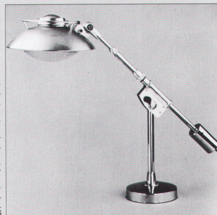
ATELIER TABLE 714