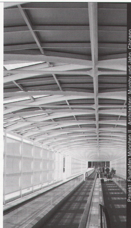
Projekt: Flughafen München II Architekten: Murphy und Jahn, Chicago

Stahl und Glasbauten in architektonisch perfekter Vollendung schaffen neue Lebens-räume für unsere Umwelt. Wir verwirklichen kreative Ideen mit höchsten Anforderungen an Materialien und Ausführung.