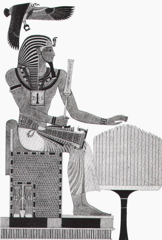
Basel, Antikenmuseum: Sethos I. vor dem Opfertisch

Genève, Musée d'histoire naturelle L'exploitation des marbres blancs dans l'Antiquité bis 31.3.