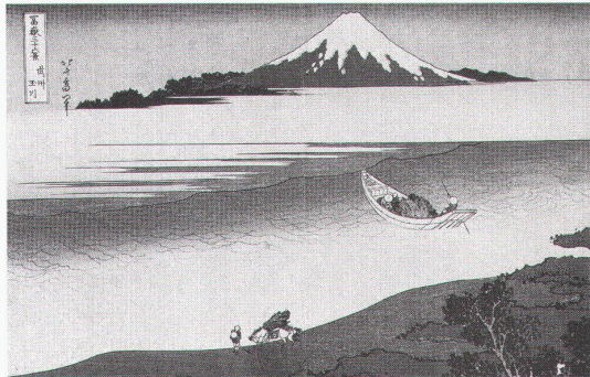
London, Royal Academy of Arts: Katsushika Hokusai (1760–1849), Bushu Tamagawa

Genève, Musée Barbier-Mueller Art Antique dans les collections du Musée Barbier-Mueller bis 4.3. Art millenaire des Amériques: de la découverte à l'admiration 1492–1992