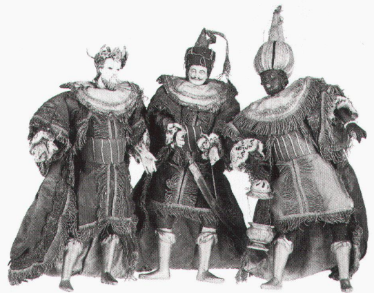
Chur, Rätisches Museum: Heilige Drei Könige. Salzburgerisch, 18. Jahrhundert

Berlin, Zeughaus unter den Linden Der letzte Kaiser: Wilhelm II im Exil bis 16.2.