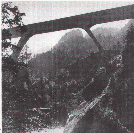
Aquädukt Châtelard VS 1988, Robert Maillart