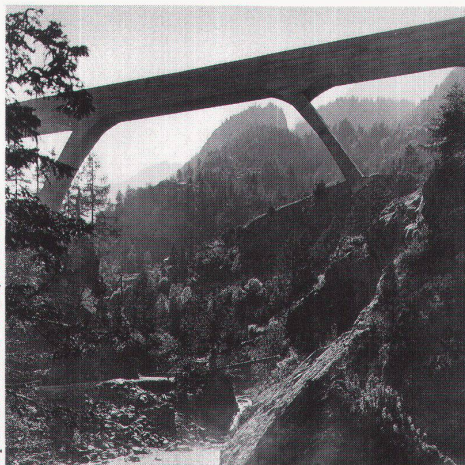
Aquädukt Châtelard VS 1988, Robert Maillart